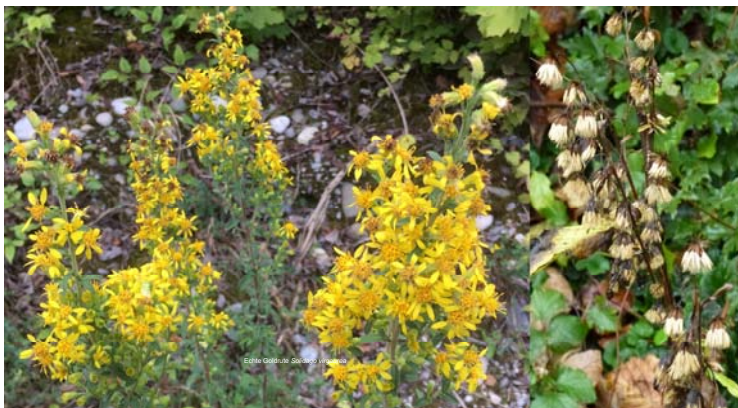
Echte Goldrute Solidago virgaurea

Mit Wildpflanzen sind alle wildwachsenden Pflanzen bezeichnet. Dazu gehören Bäume, Sträucher, Gräser, Farne und nichtverholzte, krautige Pflanzen. In der Schweiz gibt es etwa 3'000 verschiedene Wildpflanzenarten, von denen einige davon auf diesem Lehrpfad vorgestellt werden.