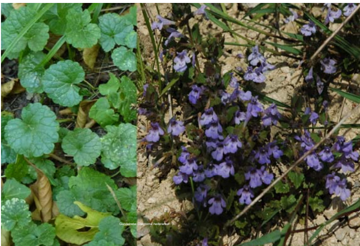
Gundelrebe Glechoma hederacea

Im Laufe des Jahres ändert sich das Aussehen der Wildpflanzen; sie blühen, bilden Samenstände aus, sind nur noch als am Boden naheliegende Knospen oder als Rosette sichtbar, oder gar nicht mehr (weil sie nur noch als Wurzel oder Samen vorhanden sind). Je nach Art ist der Lebenszyklus unterschiedlich. Der Wechsel im Aussehen der Pflanzen im Jahresverlauf lässt sich bei mehrmaligen Besuchen des Lehrpfades erfahren. Besonders attraktiv sind die Pflanzen natürlich, wenn sie blühen. Die grösste Zahl der hier bezeichneten Arten blüht Ende Mai.